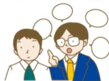
彼にうまく伝わらない…。