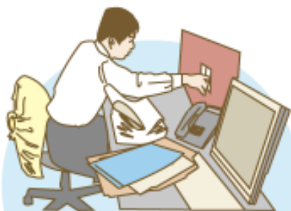
小売業管理本部・総務に トライアル雇用後正式採用 五年目のAさんの事例